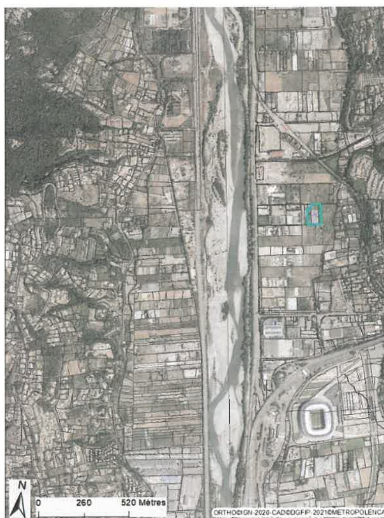
Carte 1 : Localisation des parcelles proposées pour l'appel à candidature.

Dans ce secteur, l'agriculture se caractérise par des exploitations oléicoles, des cultures maraichères, horticoles et d'agrumes. La commune est située dans le périmètre des AOP Huile et Olive de Nice et dans la zone de l'oranger.