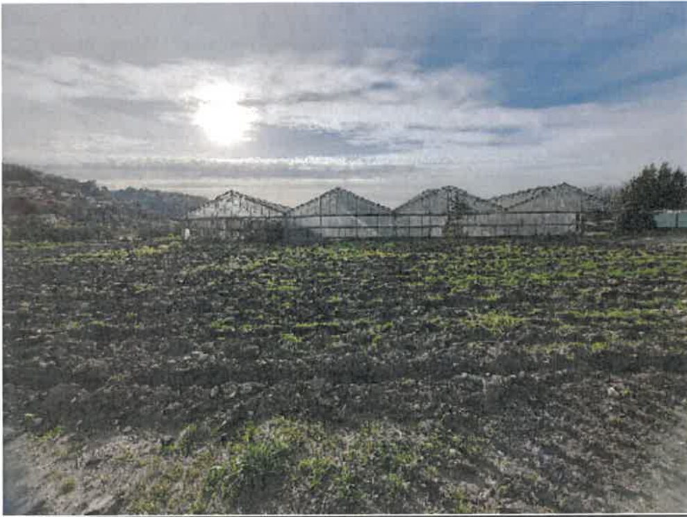
Photo 1 : 4 chapelles verres et terrain plein champ (nord de la parcelle)