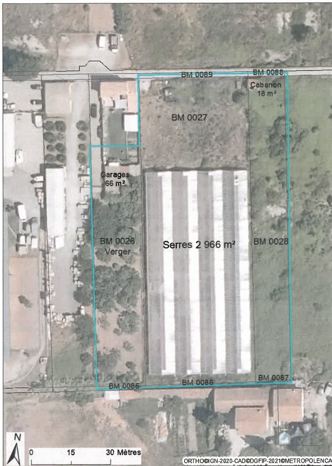
Carte 2 : Photo aérienne des parcelles cadastrales de l'appel à candidature

Le présent appel à candidature ne propose pas de logement pour le futur exploitant.